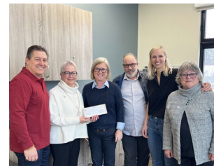
Clinique du Village