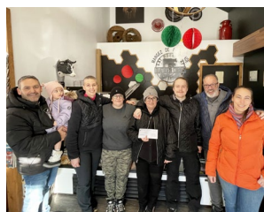
Quatuor à cornes