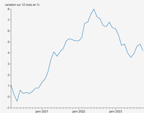
Indice des prix à la consommation Québec