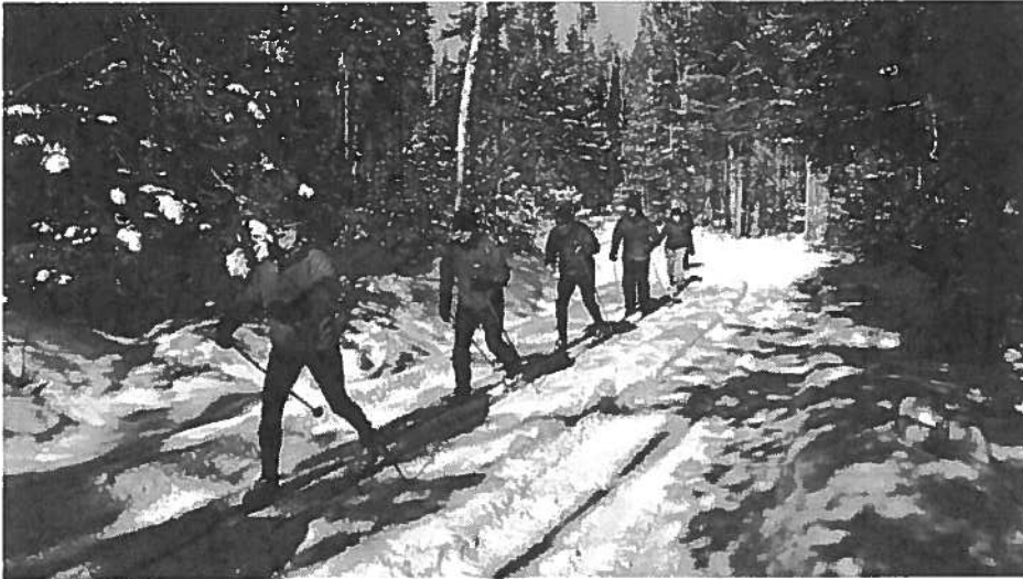
Des fondeurs glissent sur la neige de Saint-Donat.

La municipalité de Saint-Donat, dans la région de Lanaudière, a déposé une demande auprès du gouvernement fédéral pour être désignée « parc naturel habité ». L'idée n'est pas tant d'être reconnue au même titre qu'un parc national ou une réserve faunique, mais de créer une « nouvelle image de marque unique au Québec » que les entreprises de la région pourraient utiliser sur leurs produits ou dans leur publicité